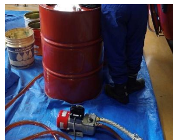
(油圧緊張ユニット更新・ゴンドラ制御シーケンサ更新・主減速機オイル交換)