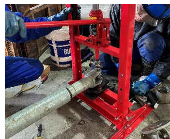
(支柱受索輪交換・出発クラッチ交換・ユニバーサルクロスベアリング交換)