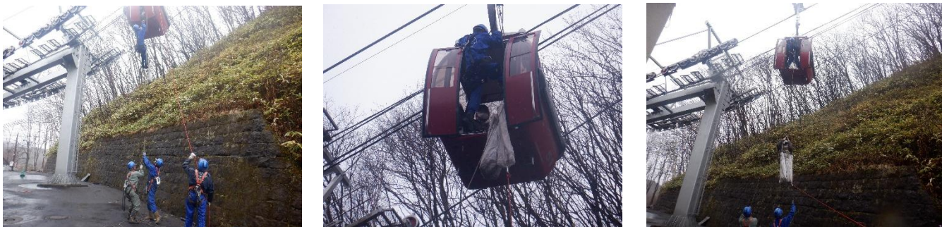
(普通索道救助訓練)