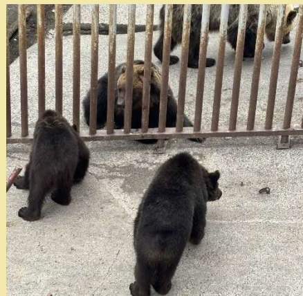
恐る恐る柵の向こうのクリンに近づくコリン(左)とカント(右) = 6月13日

雨の多いジメジメした6月も梅雨明けを迎え、ようやく過ごしやすいくらいお出かけ日和が増えてきたなあ。季節の移り変わりを実感しています。ですが、梅雨が明ければ本格的な夏が始まります。ヒグマたちは暑さにはめっぽう弱いので、個体の異常にいち早く気付けるように日々業務に臨んでいます。編集担当もヒグマ同様に暑さに非常に弱いのでこの時期はひーひー言いながら仕事をしています。遊びに行くには、夏は最高の季節ですが、炎天下で働くとなると話は別ですね(笑) ヒグマたちや飼育係の話ばかりでしたが、のぼりベツクマ牧場に遊びに来られたお客様も熱中症に気を付けてこまめに水分補給しながらヒグマたちとの出会いをお楽しみください！それでは秋号でお会いしましょう！