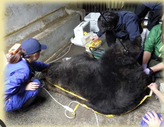
麻酔をかけて体の大きさを測定＝5月

色々と盛りだくさんな「Bear's Letter」を引き続きよろしく願います！ それではまた春号でお会いしましょう！さようなら！