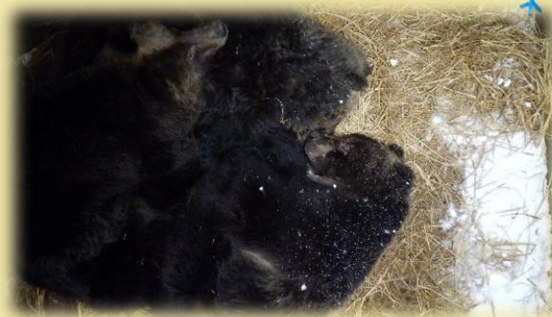
ワラの上で固まって眠る様子＝12月15日