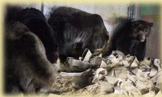
巣材を整える様子＝12月15日

今年も高齢個体の冬ごもり（疑似冬眠）を実施していきます。12月中旬から本格的な冬ごもりを行い、ワラや消防ホースなどの巣材をヒグマ達に提供しました。巣材を与えると各々前足でいじったり、粉々に噛み砕いてフカフカに整えたりする行動が見られ、しばらくすると固まって眠る様子が観察できました。毎年恒例の冬支度が始まると「ああ、今年も冬が始まったなあ」としみじみ思います。 若いヒグマは冬場でも活発に雪の上を走り回り遊ぶ個体が多いですが、高齢個体になると活動量が低下するので冬ごもりを行っています。野生個体と違い、春まで起きない訳ではなく時折水を飲みに起きてきたりすることもあります。時々SNSでも冬ごもりの様子をお届けしますのでお楽しみに！