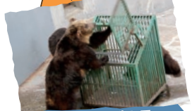
곰의 실력 테스트