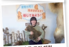
아기곰 크기 체험

생후 1일째부터 성체가 되기까지 세대별 박제, 골격 표본, 곰의 기원과 역사, 습성과 생태, 세계 분포 현황, 인축 상황 등 많은 자료를 전시.