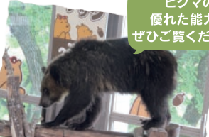
クマのアスレチック