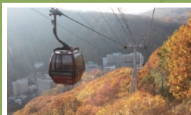
紅葉シーズンは絶景！

ゴンドラに鮭を吊りし、鮭を寒干して「鮭とば」にするためのユニークゴンドラが運行しております。（乗ることはできません）干し上がった鮭とばは、クマ用の飼料として活躍します。