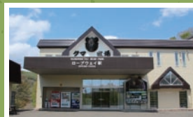
ロープウェイ山麓駅