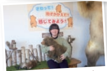
子グマの大きさを体験

生後1日目から成獣までの世代別剥製、骨格標本、クマの起源と歴史、習性や生態、世界の分布状況、人畜の被害状況など、数多くの資料を展示。