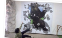
フォトリックアート