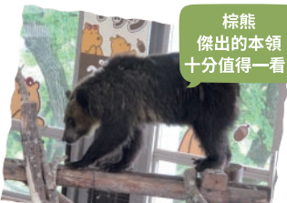
棕熊傑出的本領十分值得一看！