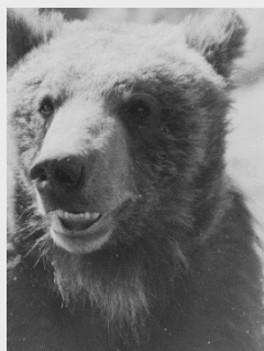
イシマツ(兄) イシマツ(弟) ボス就任期間 1965~1966