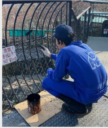
第一牧場観覧台のペンキ塗装の様子=4月19日

4月8日から26日まで、ロープウェイの法定検査で休園していましたが、この期間獣舎清掃や餌やりなどいつもの作業の他に、休園中ならではの作業を行いました。まず、お客様が快適に楽しんでいただけるよう、園内通路の補修や、あちこちの塗装作業を行いました。その他、シマリスのケージの作製や、姫路セントラルパークへのクマの搬出も行いました。