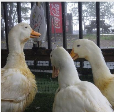
シュガー(中心)を取り合う、コジロウ(左)とギンジロウ(右) =9月11日