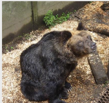
ウッドチップの上で休息するキャンコ

ウッドチップを入れたタイミンで、牧場内の土も掘り起こしました。体重が約100kgあるヒグマが地面を歩き続けると、柔らかい土でもコンクリートのようにカチコチに固くなります。その為、定期的な土を掘り起こし、少しでも足に負担がかからないように工夫をしています。今後も、木や落葉などをうまく再利用し、よりよい環境をクマ達に提供していきたいよう日々試行錯誤していきます!!