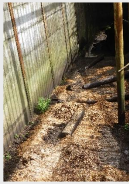
ウッドチップを撒いた後のB牧場

放飼場にクマを出すと、まずは全頭匂いを嗅いでいました。普段はコンクリートの上で寝ているアツキーも、居心地がいいのかウッドチップの上で休息し始めました。また、雨が降ると地面がぬかるむので、足腰が弱ってきたおぼあちゃんグマは放飼できないこともありました。ウッドチップが水を