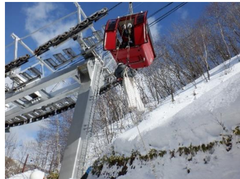
(普通索道救助訓練)