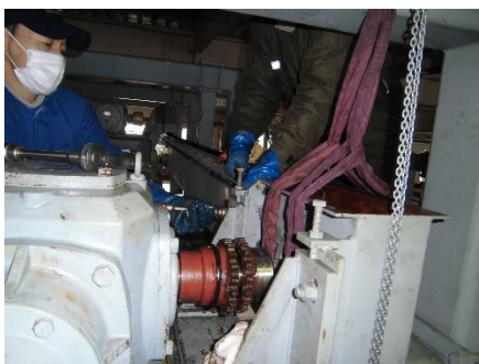
(場内 加減速駆動装置 チェーン交換・ベアリング交換整備作業)