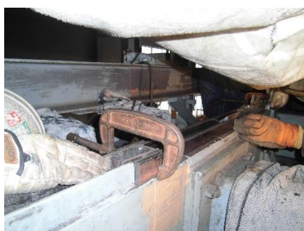
(山麓出発レール交換作業)