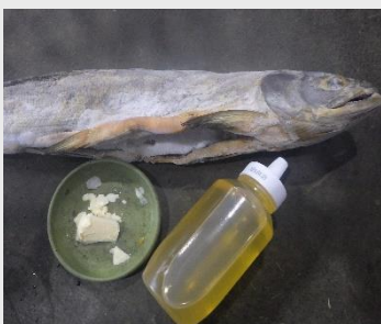
クマ達から大人気のハチミツ、鮭、アイスクリーム =5月12日