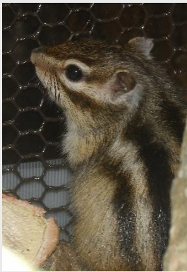
シマリスのチャイ =5月12日

もたくさん違うところがあります。実際に見比べながら、どんな違いがあるか探してみてください。