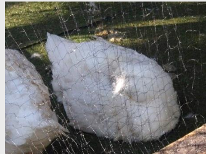
新しくなった人工芝の上で お昼寝するアヒル=10月25日

飼育下のアヒルは運動量が少ないため、足の裏に瘤ができる「趾瘤(しりゅう)症」になりやすく、足のケアとして床材はとても重要になります。色々試すと、お風呂マットはクッション性があり、アヒルの足に良いことが分かりました。しかし、レース場にお風呂マットは少し違和感があるため、お風呂マットの上に軟らかい人工芝を被せると、アヒルもそこでお昼寝をしてくれるほど気に入ってくれました！