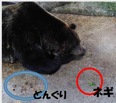
どんぐりは食べて殻だけが ネギには見向きもしない ショースケ=10月25日

のぼりべつクマ牧場では「クマの腕試し」というイベントで、ネギ類を使ってクマの反応も試していますので、来園された際はご覧になってみてください。