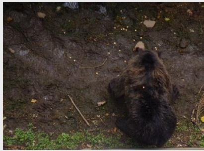
少しずつ草が定着するように なったB牧場=8月28日