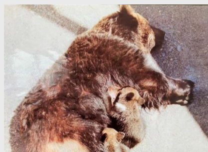
母グマのおっぱいを 飲む子グマ2頭

るため、2019年には落ち葉を、2020年には茅(かや)を入れてみました。そうして、今年は土が軟らかくなってきた、雑草を植えるについにいくらか定着してくれました。いつか、草原での昼寝を実現させてあげるべく、奮闘を続けます！