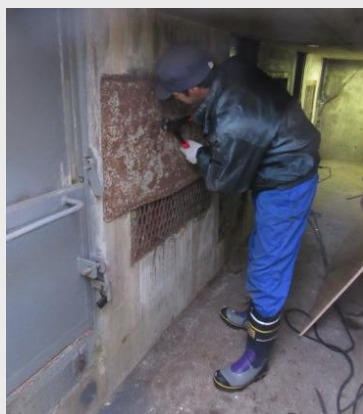
産室を整備する飼育員=12月17日、産室

今年5頭のメスグマが産室入り予定しています。無事に産産が行えるよう、飼育員一同全力でサポートしていきます！