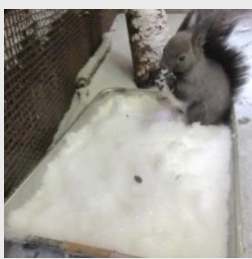
雪の中からヒマワリの種を探し当てた=12月7日、セイジ