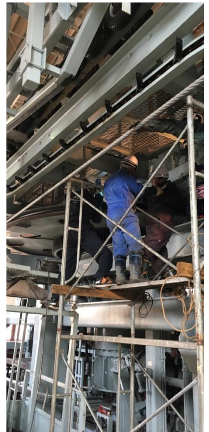
(原動滑車ゴムライナー交換)