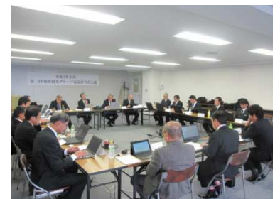
(グループ索道担当者会議)