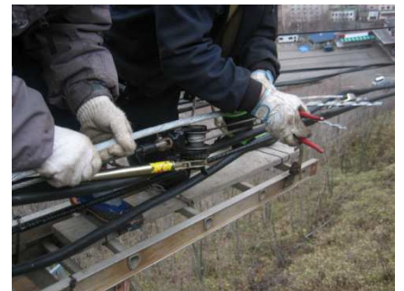
(線路通信線補修作業)