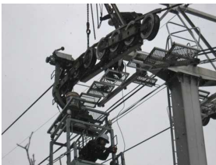
(線路支柱索輪交換作業)