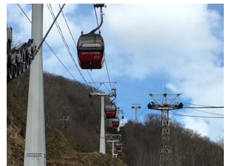
(荷重制動試験 上り 100%下り 0%)