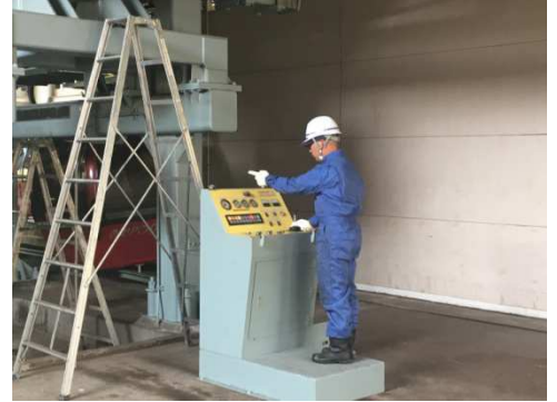
( 普通索道救助訓練 )