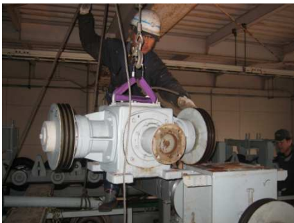
(ギヤボックス交換作業)