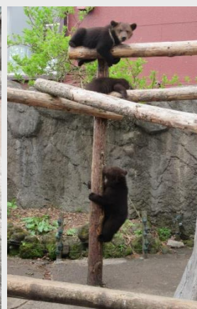
木登りする3頭＝5月28日

っているからです。また、子グマ牧場内の水路で遊ぶ姿もたびたび見かけるようになりました。