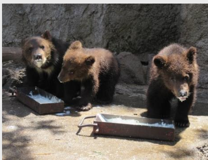
離乳食を口にする子グマたち＝ 5月29日

5月24日から離乳食を始めました。いきなりではなく徐々に離乳をさせるため、毎日飲んでいくヒグマ用のミルクの中に粉末の配合飼料を混ぜて与えています。