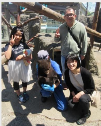
記念撮影のようす 5月20日、子グマ牧場

間近で子熊と写真が撮れるイベント「子グマと記念撮影」が4月～5月の土日祝日で開催されました。ゴールデンウィークは午前午後の各回20組限定で行い、幅広い年代の方に参加いただき大反響の内に無事終了しました。初めて子グマを間近で見た小学生の方は「ぬいぐるみみたいでかわいい」と満面の笑みで語っていました。