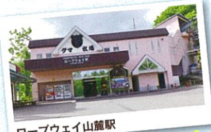
ロープウェイ山麓駅

高速ゴンドラ(通常6人乗り)が約15秒間隔で出発。山麓駅から山頂まで全長1260m、高低差300mを約7分で一気に駆け登ります。