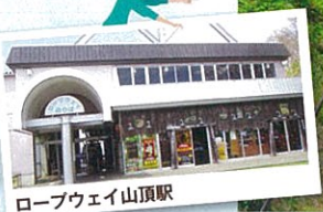
ロープウェイ山頂駅