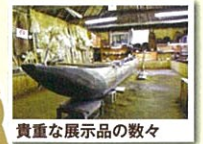
貴重な展示品の数々