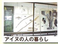
アイヌの人の暮らし