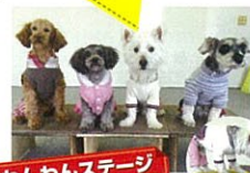
わんわんステージ