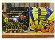
ヒトのえざチョコクッキー ¥400