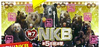
ご存じ!NKB 第5回総選挙