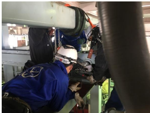
(ギヤボックス交換作業)