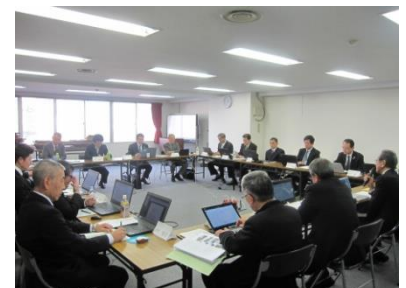
(グループ索道担当者会議)