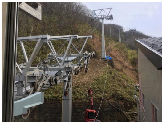
(線路支柱索輪交換作業)