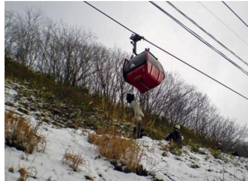
(普通索道救助訓練)