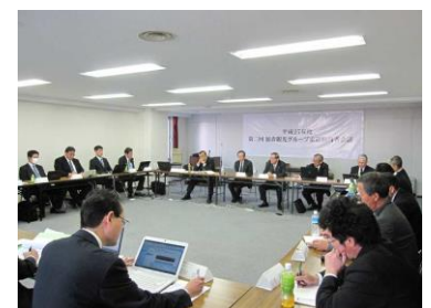
（グループ索道担当者会議）