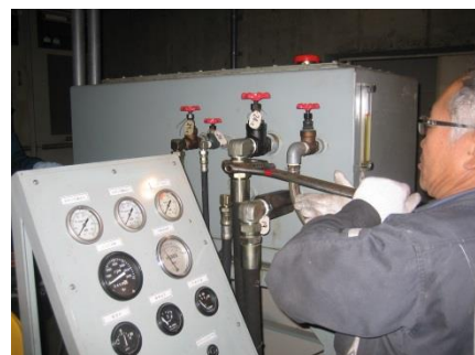
(荷重制動試験時のウエイト積み込み)