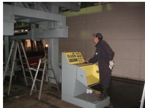
( 普通索道救助訓練 )